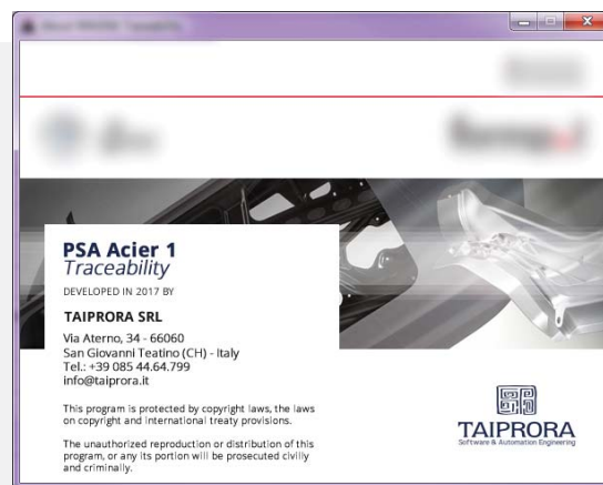
Taiprora ha realizzato questo Sistema di Tracciabilità nel 2018

C'è un continuo scambio di informazioni tra questi 3 livelli Livello 1 (PLC di linea e robot) Livello 2 (3 PLC di tracciabilità) Livello 3 (software di controllo e visione in tempo reale della tracciabilità).